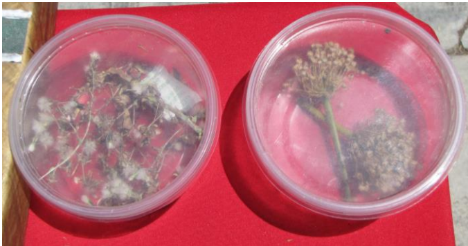
Semilla de lechuga y de cebolla